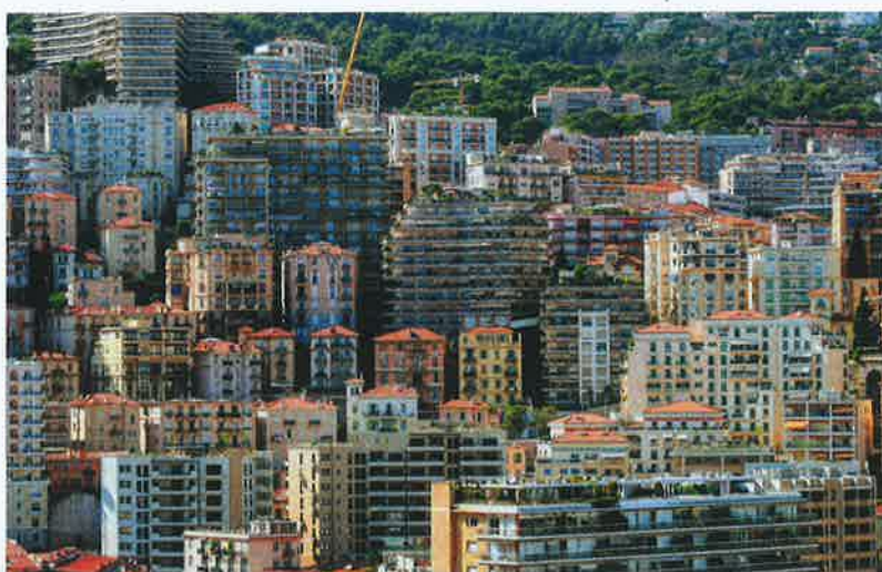
Monaco, l'État le plus dense au monde.

Calquant les labels BDM (Bâtiments durables méditerranéens) de l'association EnvirobatBDM, qui valorise les niveaux